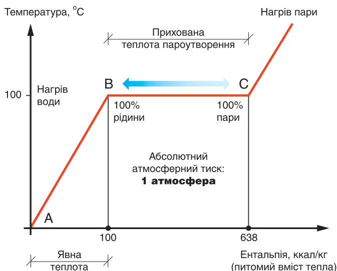
Рис. 1: Залежність температури від ентальпії води при пароутворенні/конденсації

У теплотехніці існує поняття верхньої та нижньої теплотворної спроможності газу. Їх показники відрізняються між собою саме на це значення додаткового тепла